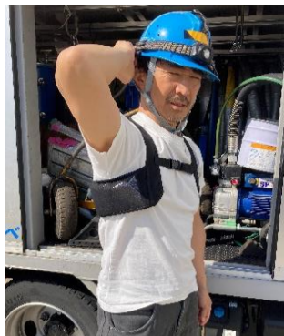
①アイスベストで脇下を冷やす