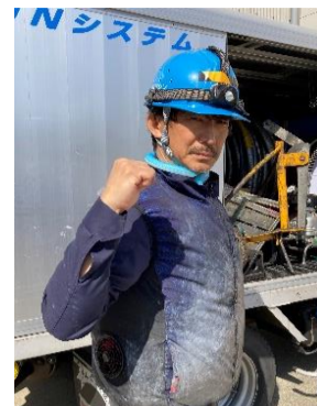
③そして空調服を着て熱中症対策

「昨今の夏の暑さは半端ありません！昨年より私は、空調服の下にアイスベストを着て作業しています。アイスベストはセットで保冷剤が4つ付いてますが、私は倍の8つ用意し、クーラーに予備の保冷剤を入れ、約3時間ごとに脇下交換して、熱中症対策しています。空調服の下に アイスベスト ！熱中症対策におすすめいたします。」 屋上防水UNマシンオペレーター