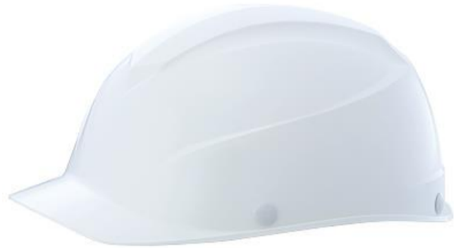
「超かるメット」 A:ホワイト