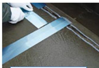
メジパス 従来品 (表面：青色塗装)

既存保護コンクリート伸縮目地撤去後の乾式目地処理工法に用いる、アルミ製目地キャップ「メジパス」は、表面仕上げを変更いたします。従来品は表面が判別しやすいよう青色の塗装でしたが、新規品は表面側を黒ラインで表示した仕様となります。形状は長さ・厚さに変更なく、従来品と同様にお使いいただけます。9月21日以降、現行品の在庫が無くなり次第順次切り替え実施となります。