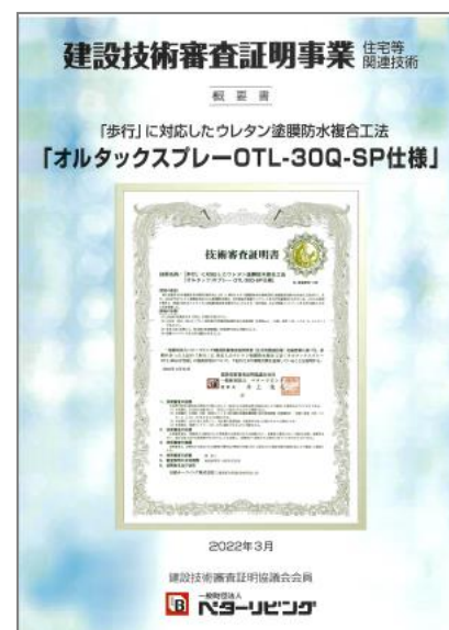
「オルタックスプレー」 建設技術審査証明 概要書 一般財団法人 ベターリビング