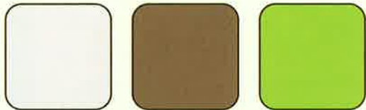
シティグレー コルクブラウン フレッシュグリーン