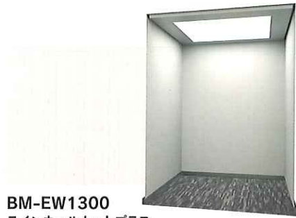
BM-EW1300 ラインウォールナットプラス