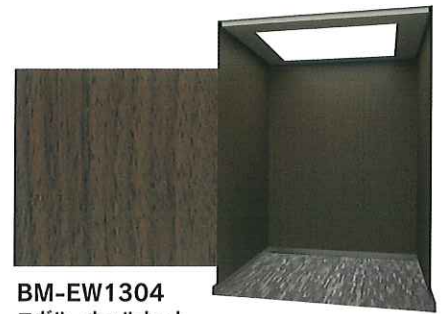
BM-EW1304 エヴルーウォールナット