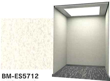
BM-ES5712 シルキーフロスト