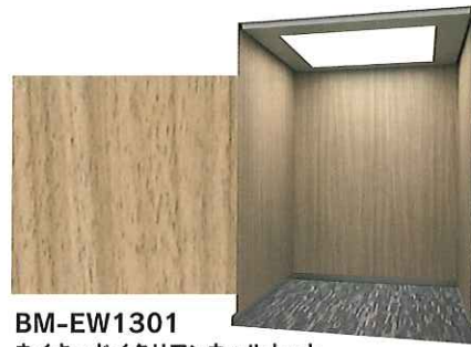
BM-EW1301 ネイキッドイタリアンウォールナット